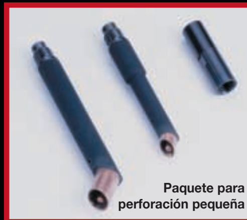
Paquete para perforación pequeña