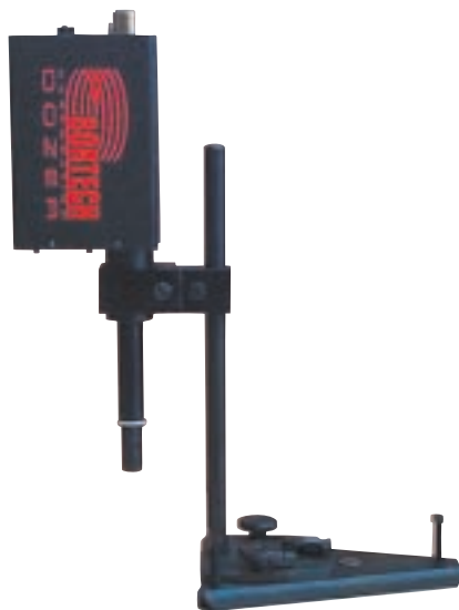
El modelo DOZER con una base ajustable optativa.

¡El momento que estuvo esperando ha llegado! Ya no necesitará elegir entre calidad o bajos costos iniciales. Le presentamos DOZER de Bortech. ¡La calidad a su alcance! La tecnología para soldaduras de alta calidad está ahora disponible en un sistema al alcance de su bolsillo, extremadamente portátil y muy resistente. Tanto si utiliza la base ajustable de Bortech como si lo conecta a la barra de perforación, el montaje y alineación del modelo DOZER es rápido y fácil para permitirle iniciar las tareas de reparación en pocos minutos. El funcionamiento del modelo DOZER es igualmente sencillo y no requiere ningún esfuerzo. La opción es clara: el soldador DOZER de Bortech es la mejor manera de comenzar a soldar.