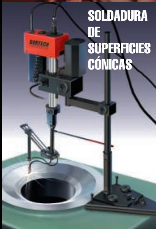
SOLDADURA DE SUPERFICIES CÓNICAS

SOPLETE CON ELIPSÓGRAFO —Reconstrucción de diámetros externos de hasta 35,5 cm (14 pulg.), hasta 25,4 cm (10 pulgadas) del borde del diámetro externo.