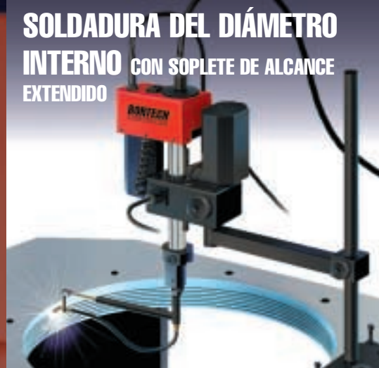
SOLDADURA DEL DIÁMETRO INTERNO CON SOPLETE DE ALCANCE EXTENDIDO

SOPLETE RADIAL —Permite la reconstrucción en espiral de caras de hasta 50,8 cm (20 pulgadas) EQUIPO CON CONTRAPESO PARA SOPLETE —Para el uso horizontal de sopletes No. 6 y más grandes y de sopletes radiales, con elipsógrafo y de alcance extendido.