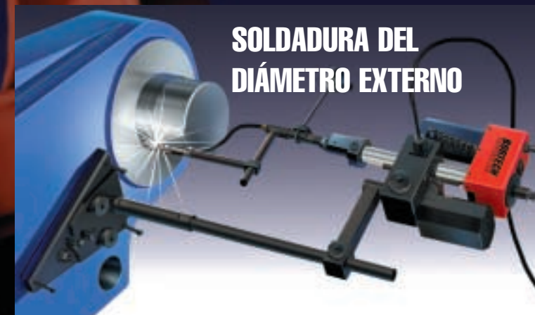
SOLDADURA DEL DIÁMETRO EXTERNO

SOPLETE DE ALCANCE EXTENDIDO —Reconstrucción del diámetro interno de 66,04 a 137,16 cm (26-54 pulgadas).