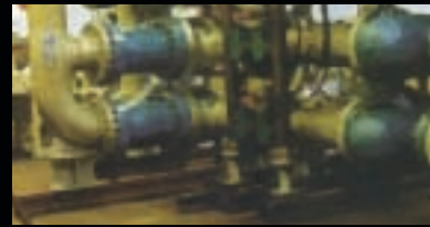
BOMBAS / VÁLVULAS GRUPOS ELECTROGENOS