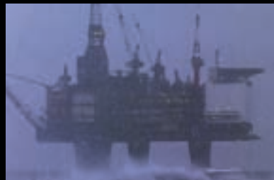
EXPLOTACIÓN SUBMARINA/ PETRÓLEO

SOLUCIONES PRÁCTICAS PARA SOLDADURAS COMPLICADAS CON DIÁMETROS DESDE 1,27 CM A 365 CM (0,5 PULG. A 12 PIES).