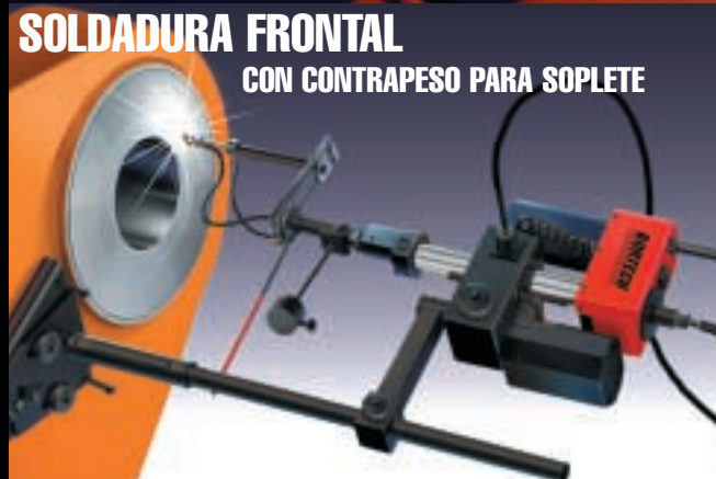
SOLDADURA FRONTAL CON CONTRAPESO PARA SOPLETE

Gracias a la posibilidad de compartir el montaje, un tiempo mucho menor de soldadura y eficiencia en el maquinado, usted tendrá que dedicar menos de la mitad del tiempo que cuando usa bujes, soldadura manual u otras alternativas. La soldadura automática con BORTECH ahorra tiempo, trabajo y dinero.