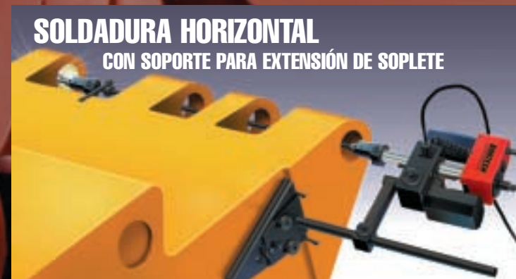
SOLDADURA HORIZONTAL CON SOPORTE PARA EXTENSIÓN DE SOPLETE

DISPOSITIVO PARA PERFORACIÓN CÓNICA —Permite reconstruir asientos de las válvulas y otras superficies cónicas de hasta 50,8 cm (20 pulgadas)